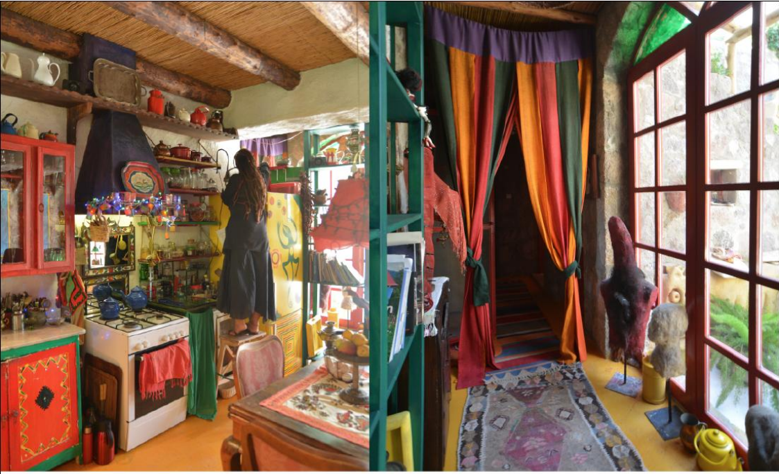
Pahalı ve lüks objeleri sevmiyor Mine ve Bahadır. Evi bir harcama alanı olarak görmüyorlar. Mine tam bir bitpazarı delisi. Mutfak dolaplarını dahi Çukurcuma'da dolaşan seyyar eskicilerden almış. Fırının üzerindeki camaltı aynalar da Manisa, Akhisar'da, yol üzerindeki bir eskiciden. Davlumbazı Bahadır çizmiş, marangoz yapmış. Davlumbazın üzerindeki tepsi ise Üsküdar bitpazarından. Çaydanlıklar Tahtakale'den. Salonla mutfak iç içe. Bahadır'ın çalışma masası da bu salonda. Yerdeki kilimi Cizre den almışlar; koltuklar ise Üsküdar'daki bitpazarından. Kapının ve rafın üstündeki heykelleri ise Bahadır yontmuş.